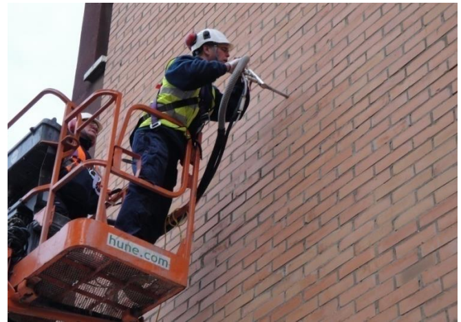
Figura 6.2: Inyección del sistema ThermaBead®.

El titular del DAU dispone de un manual específico para la inyección mediante lanza.