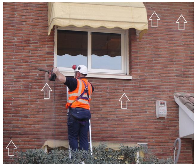
Figura 6.1: Perforación de la fachada según el patrón establecido.

El muro debe perforarse completamente antes de comenzar con la inyección del aislante, con el fin de evitar que el polvo formado al taladrar caiga sobre el aislante a medio inyectar.